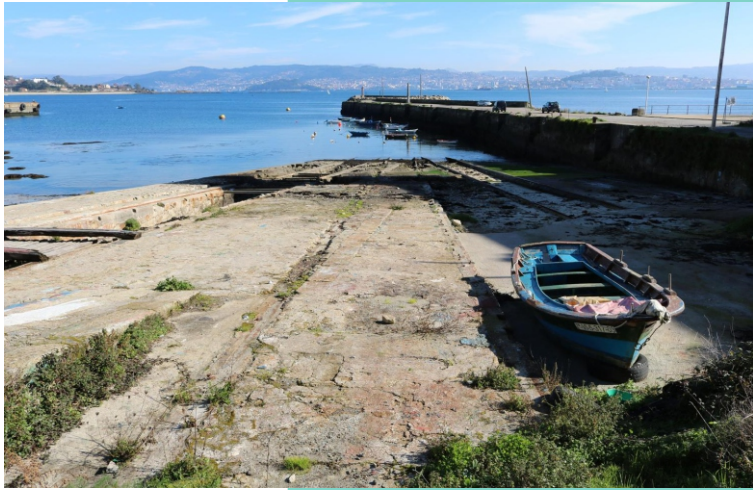
Peirao do Salgueirón