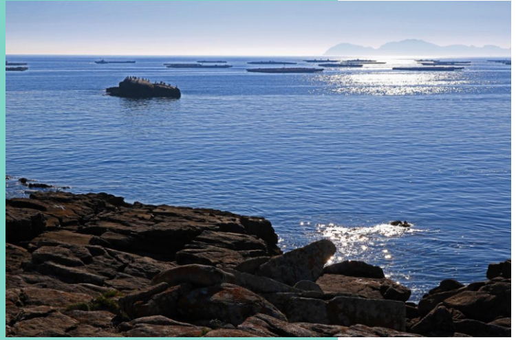
Punta Borneira e Con do Corveiro