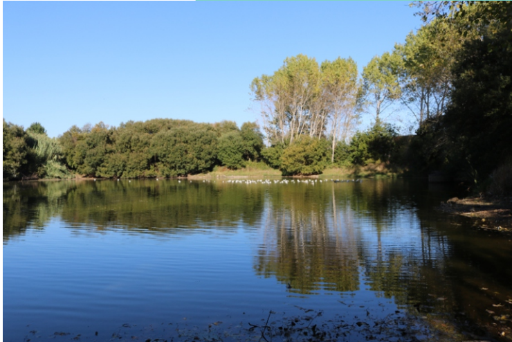
Lagoa da Congorza