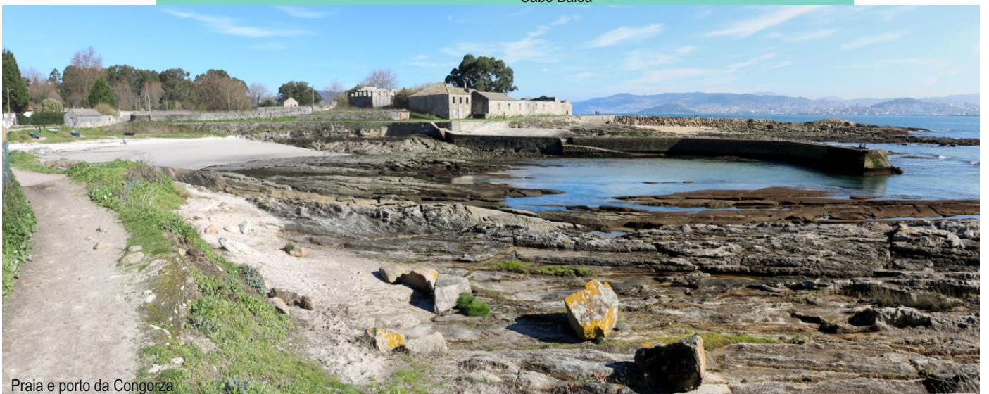
Praia e porto da Congorza