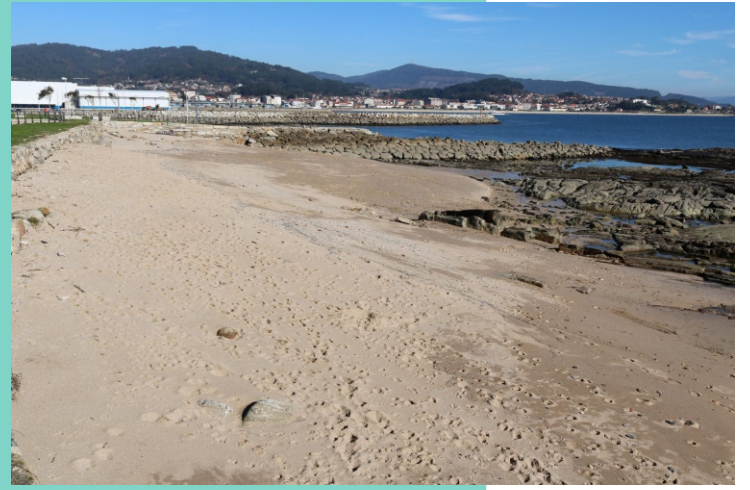
Praia da Bouciña ou da Cunchiña