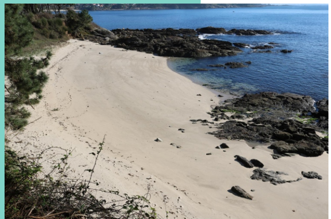
Area das Moscas