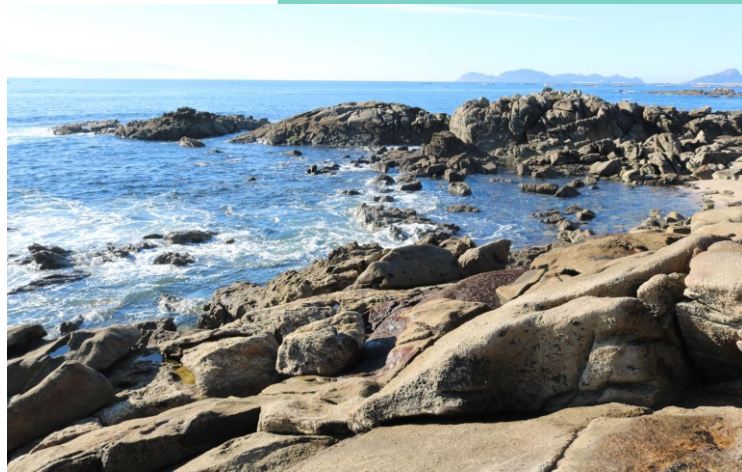
Punta da Rocha dos Patos