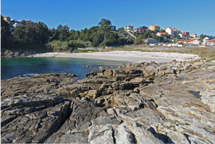
Praia de Areamilla desde o Puntal de Areamilla