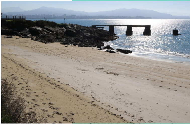
Punta e praia Rodeira