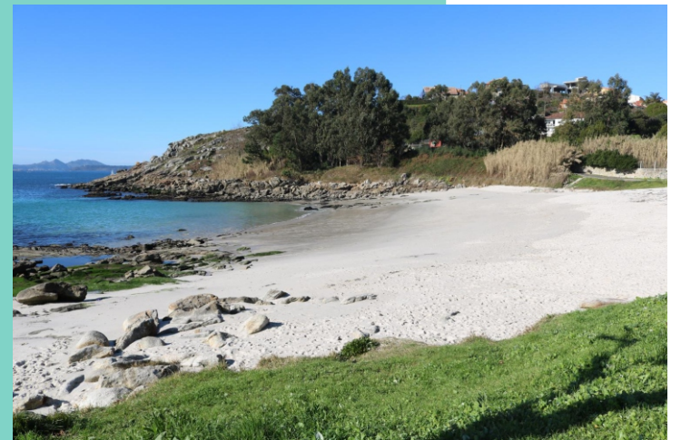
Praia de Areamilla e punta Niño do Corvo