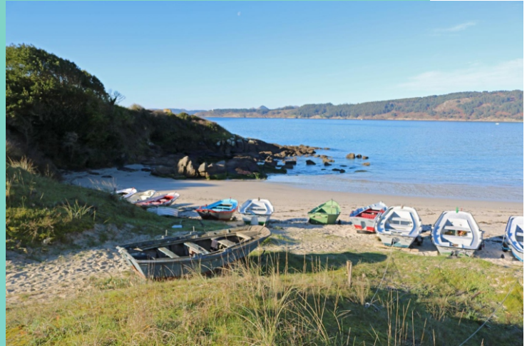
Praia da Folla de Nerga e punta Creixiña