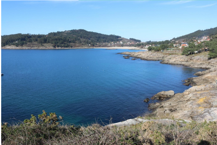
Enseada de Liméns coas puntas do Corveiro e do porto