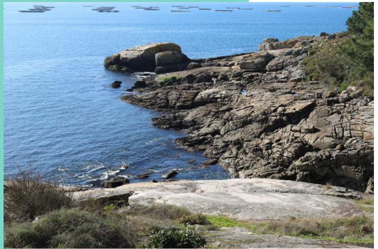
Punta do Fanequeiro.