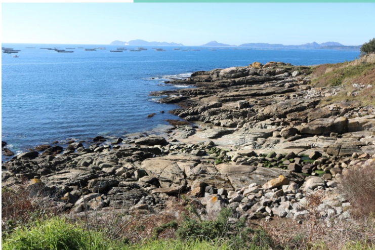
Enseada e punta de Entremuíños