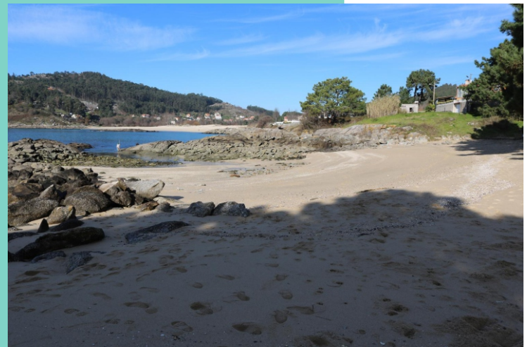
Praia do Porto de Santa Marta