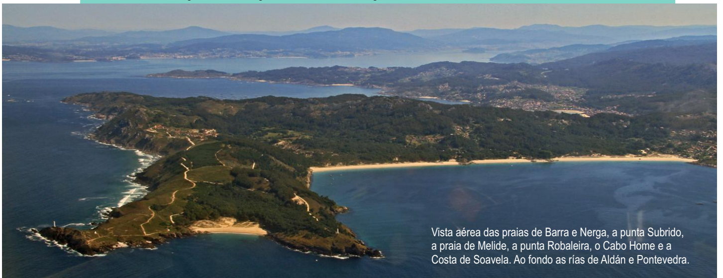
Vista aérea das praias de Barra e Nerga, a punta Subrido, a praia de Melide, a punta Robaleira, o Cabo Home e a Costa de Soavela. Ao fondo as rías de Aldán e Pontevedra.