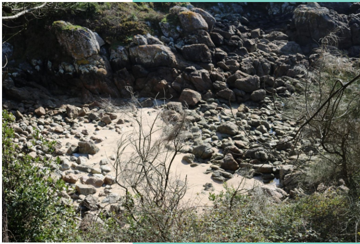
Enseada do Rei. Praiña do Angueiro