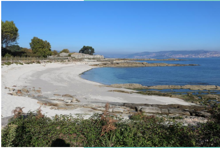
A Ribeira do Medio