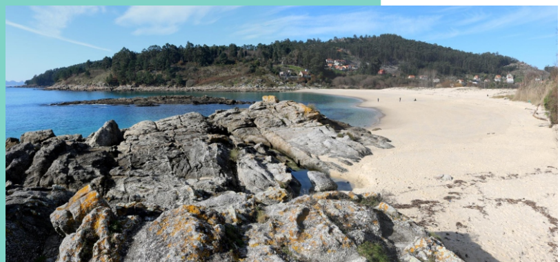
Praia de Liméns e punta da Rochas dos Patos