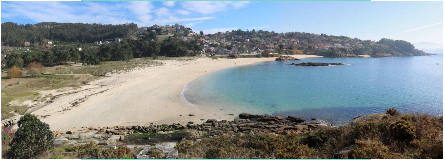
Praias de Liméns e Santa Marta separadas pelas Pinelas Vella e Nova