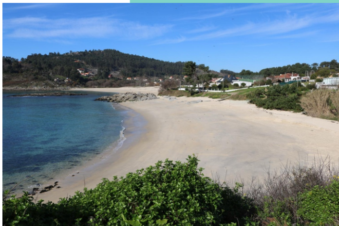
Praia de Santa Marta e Punta Pinela Vella