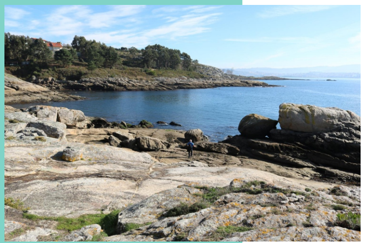
Enseada do Rei