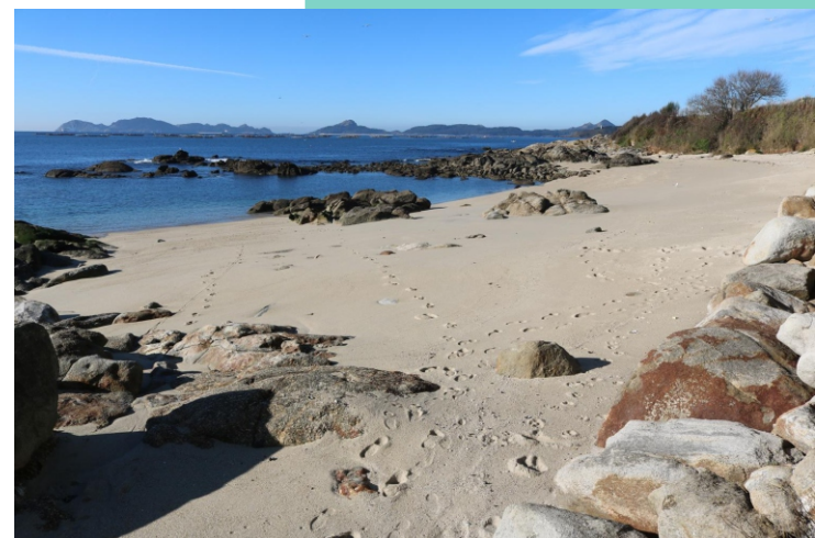
Praia dos Castros