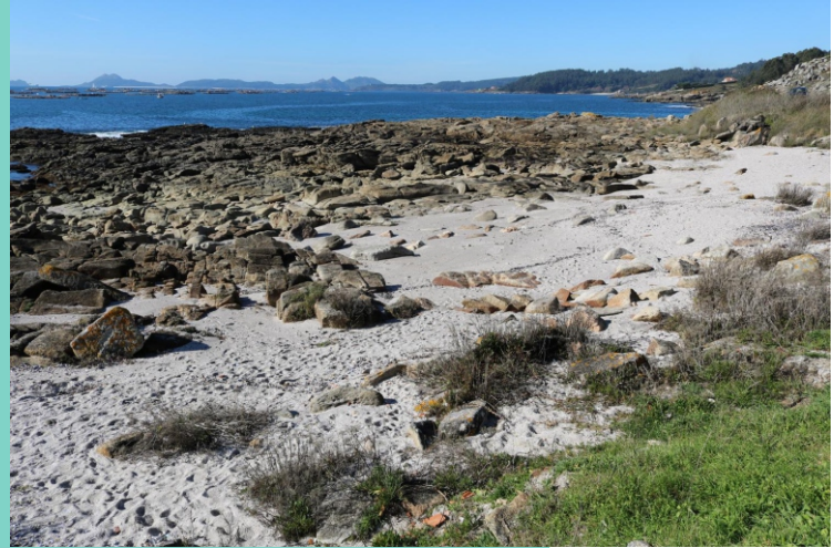
Praia das Vellas