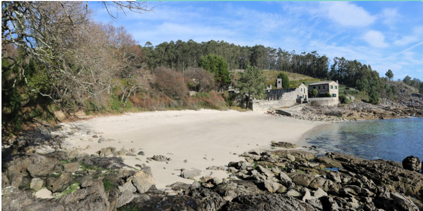
Praia de Temperáns