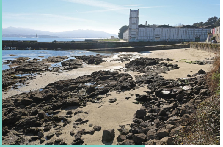
O Salgueirón e antiga conserveira de Massó