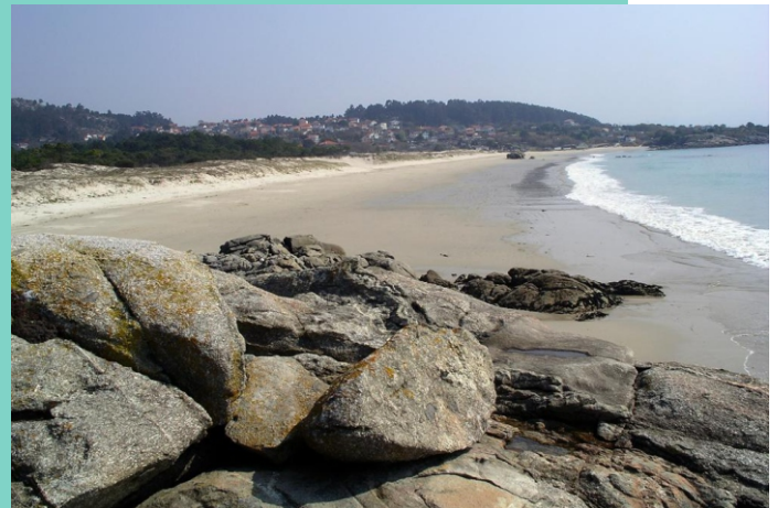
Praia de Barra, Punta Preguntouro, Area meán, Praia Nova, Punta Mexiloeira, Praia de Nerga, O Con e Nerga e Praia da Folla de Nerga.

A praias de Nerga e Barra forman un areal de 2 km de lonxitude separadas por saíntes rochosos. Conservan un amplo sistema dunar sobre o que se asenta un bo número de especies de interese e pouco comúns.