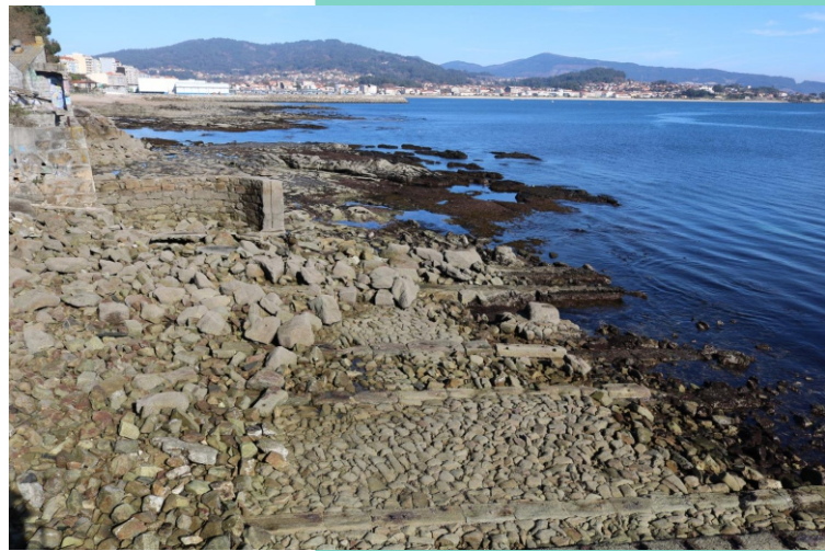
Rampas da antiga factoría baleeira