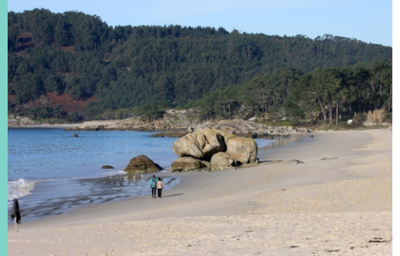
Praias Folla de Nerga, O Con e Nerga.