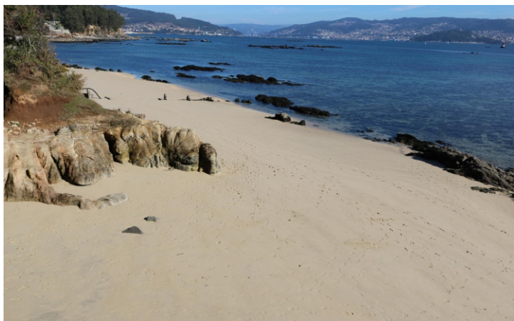
Praia da Cova da Lontra