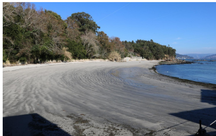
Praia do Canabal

Pódese seguir camiño polas praias de Area Meán e de Barra e desde a praia de Barra coller un carreiro para ir á punta Sobrido , a praia de Melide e ao cabo Home .