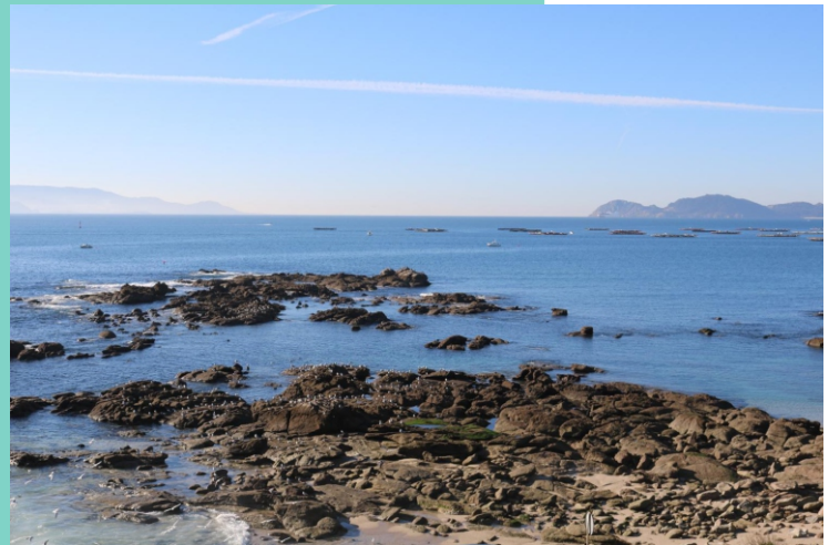
Punta Corveiro dos Castros