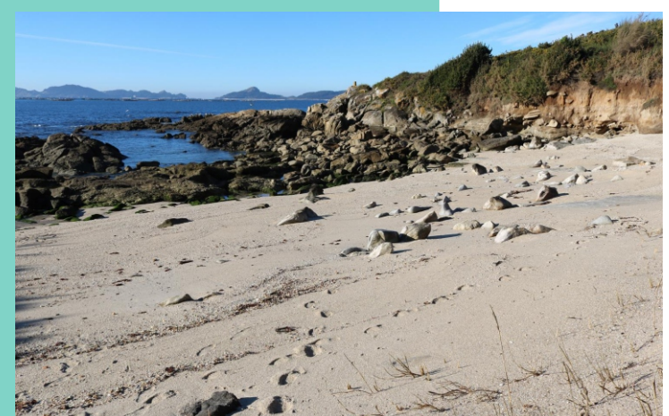
Praia da Masa