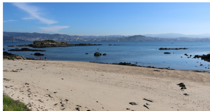
Praia dos Alemáns e illa dos Ratos